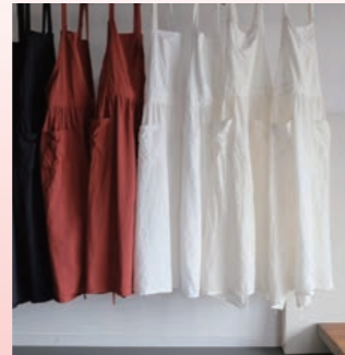
程よくギャザーを寄せたエプロン

店舗としての営業はしていませんが、オンラインショップにて販売しています。Instagramにて随時更新しておりますので、ぜひご覧ください。