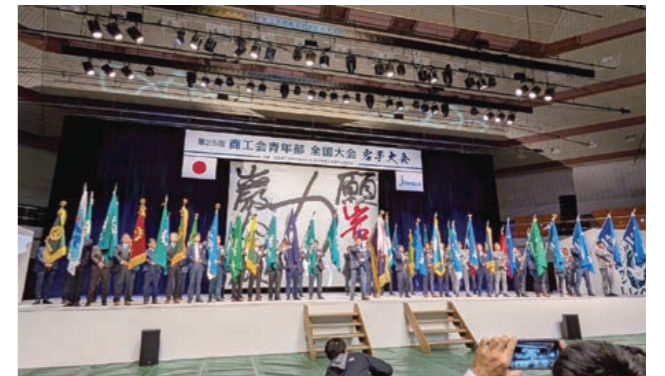
大会フィナーレの様子