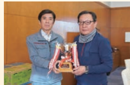
優勝トロフィー贈呈