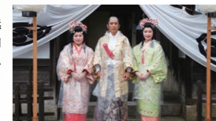
殿様の名合会長と姫君

11月9日(日)に第50回矢掛の宿場まつり大名行列を開催しました。時折小雨の降る中でしたが、華やかな衣装に身を包んだ77人の行列が矢掛商店街を練り歩きました。また、50周年の今回は、最後に矢掛の魅力が詰まった特産品を景品とした抽選会を行い、大勢の方が参加され、活気あふれるひとときとなりました。