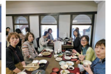
お昼ごはんの様子