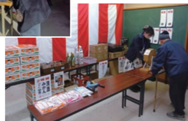
吉井地区(商工会芳井支所)