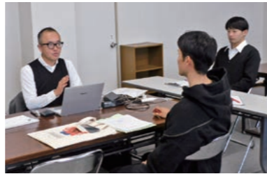
個別相談会の様子

今年度は(株)アルマ経営研究所から3名の中小企業診断士の先生を講師に迎え、10月から11月にかけて創業塾を開催しました。創業塾にはこれから創業を目指す方、創業されて間もない方9名が参加され、「経営、財務、人材育成、販路開拓」といった経営者として必要な知識を幅広く学んでいただきました。また、講義に加え、11月12日(水)・14日(金)には個別相談会を行い、参加者の課題解決に向けたアドバイスを行いました。