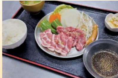
風のしたくセット