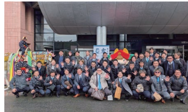
参加した岡山県内の商工会青年部員

来年の青年部全国大会は商工会青年部・女性部全国組織化60周年記念の年となり、東京で開催される予定です。