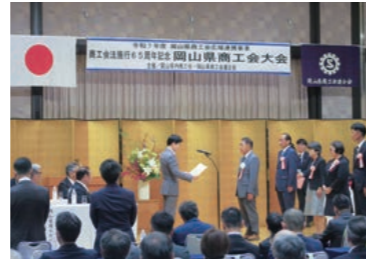
岡山県商工会大会

令和7年度の岡山県知事表彰及び全国商工会連合会会長表彰を備中西商工会から5名が受賞され、岡山県商工会大会・商工会全国大会にて表彰式が執り行われました。受賞者の皆様、誠にありがとうございます。