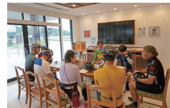
真剣に聞き入るミニ講座

さらに、10月15日には、設定している8つのルートの中から4ルートを選定・結合したアレンジルート(約39km)を実際に走行する試走ツアーを、参加者11名にて開催した。ツアー前に、ミニ講座「ムリ・ムダを省き、疲れない乗り方を知る」を実施し、「①ライディングポジションとフォーム、効率的なペダリング、②無理・ムダを省くための走行技術、③クランク回転数の高低差を抑えるシフトテクニック」などを学び、ストレスなく快適に走行できるかを体験した。参加者全員が無事完走し、終始和やかな雰囲気の中で実践的な検証ができる有意義なイベントとなった。