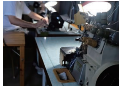
ひとつひとつ心をこめて製作しております