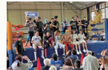
OPG俺たちプロレス軍団

祭りの最後には紅白餅やお菓子を撒く福まきが盛大に行われ多くの来場者の笑顔が見られた一日となりました。