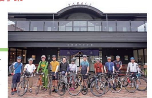
道の駅 山陽町やかげ宿を出発

本事業は、備中西商工会(芳井・井原・矢掛)地域のサイクリングの魅力発信事業であり、本年度は「高低差グラフの導入」や「スマートフォン対応(Web発信)」など、マップ機能の一層の高度化を図った。あわせて、サイクリストが利用しやすいスマホ対応のホームページを新たに開設し、訪れるサイクリストに対して本格的にPRを行える体制が整った。