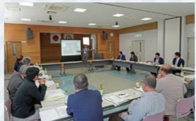
菊陽町商工会との交流会