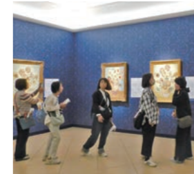
大塚美術館で鑑賞中

道の駅くるくる なるとでは、鳴門金時やわかめなど鳴門産食材を使ったお土産が沢山あり、部員は買い物等を楽しみ地域経済に貢献することができました。