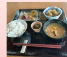
からだにやさしいランチ・おやつ