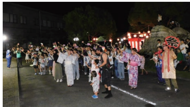
皆で踊ろう宵サー

今年は会場を移し小田川堤防周辺での実施となりました。実行委員皆様のご尽力により会場準備が進められ、当日は大勢の来場者で賑わいました。クライマックスでは、恒例の花火が夏の夜空いっぱいに打ちあがり、会場を埋め尽くした観客から歓声が上がりに盛りました。