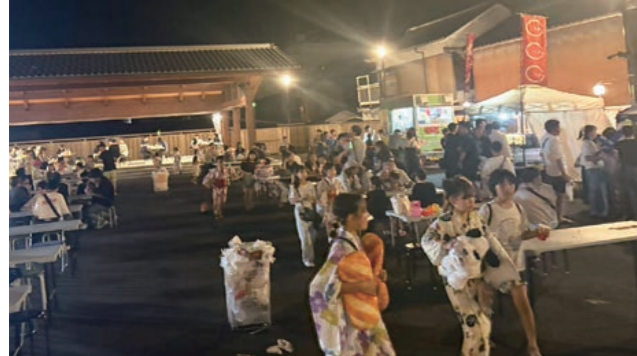
西町イベント広場の様子