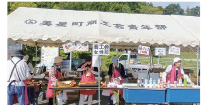
女性部出店の様子