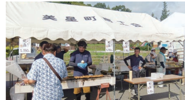
青年部出店の様子

9月7日(日)に星の郷青空市で第19回美星ピオーネまつりと満天豚まつりが同時開催されました。美星ピオーネの即売会と新米「星むすめ」おにぎりの試食会や井原早雲太鼓・子ども神楽・バルーンアートなどの催事も行われました。商工会からは青年部・女性部が出店し、大盛況で出店品を多くの方にお買い求めいただきました。