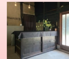
古民家を活かした内装