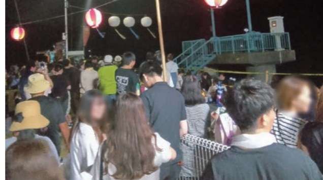
花火を楽しみに待つ観客