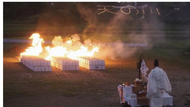
お焚き上げの様子

7月26日(土)に芳井生涯学習センターにて、芳井宵まつり2025を開催しました。今年も芳井地区内外から多くの子供たちや家族連れが訪れ、ステージイベントや様々な出店・展示を堪能しました。会場内は暑さに負けない子供たちの笑顔と歓声で溢れていました。最後に行われる恒例の宵サーの総踊りでは、参加者が一体となり芳井町の夏を大いに盛り上げました。