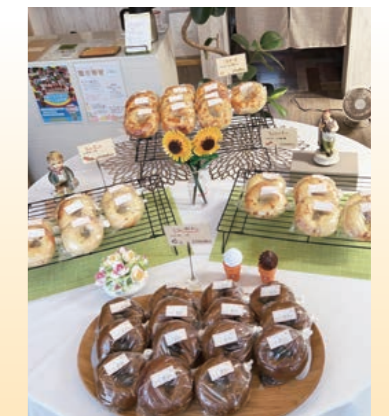
もちもちのベーグル