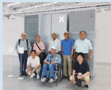
工場内・蓄電池前での集合写真

8月28日(木)に、国内最大級の蓄電池組み立て工場である株式会社パワーX本社工場(玉野市)を8名で見学しました。