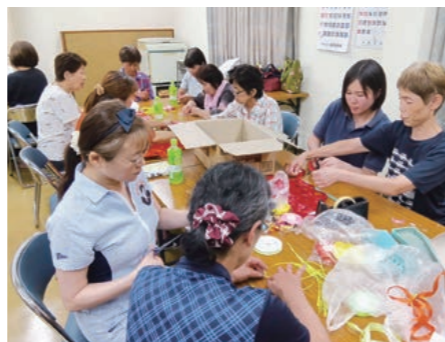
ポップリ作製中の様子

9月24日(水)には、毎年交通安全に尽力した団体の功績を讃える表彰式がイオンモール岡山にて行われ、備中西商工会女性部が表彰されました。大変喜ばしく思います。これを励みとし、今後もこうした活動を継続し、地域に貢献していきたいです。