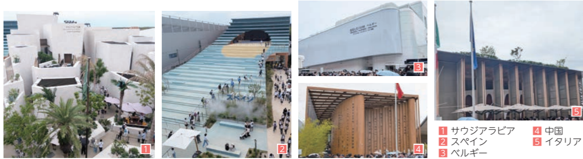
1 サウジアラビア 2 スペイン 3 ベルギー 4 中国 5 イタリア