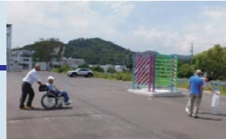
敷地内の芸術作品を見学する様子

また、「瀬戸内国際芸術祭2025夏会期」の開催中でもあり、工場の内外に展示されている芸術作品を楽しむこともできました。