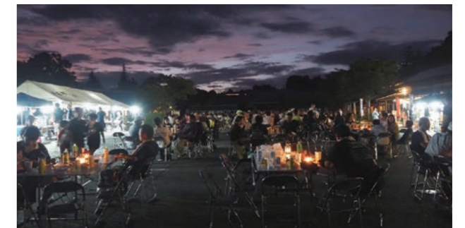
雰囲気も最高です