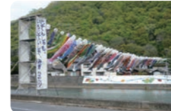
小田川を元気に泳ぐこいのぼり

また、この事業を実施するにあたりご支援・ご協力をいただいた地域の関係者の方々、また、こいのぼりを提供していただいた方々には、心よりお礼申し上げます。