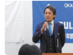
挨拶を行う原田部長