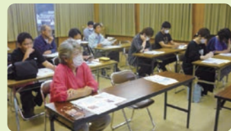
熱心にセミナーを聞く受講者

参加者からは「実践できる方法をもっと学びたい」などの声を聞くことができ、大変有意義なセミナーとなりました。