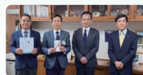
図書物品等の寄贈 (芳井小学校)