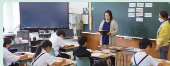
美川小学校での租税教室

(公社) 井笠法人会 (笠岡支部・井原支部・矢掛支部) では、租税教育活動や社会貢献事業、経営支援事業などの事業を行っています。