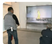
消火器での消火訓練