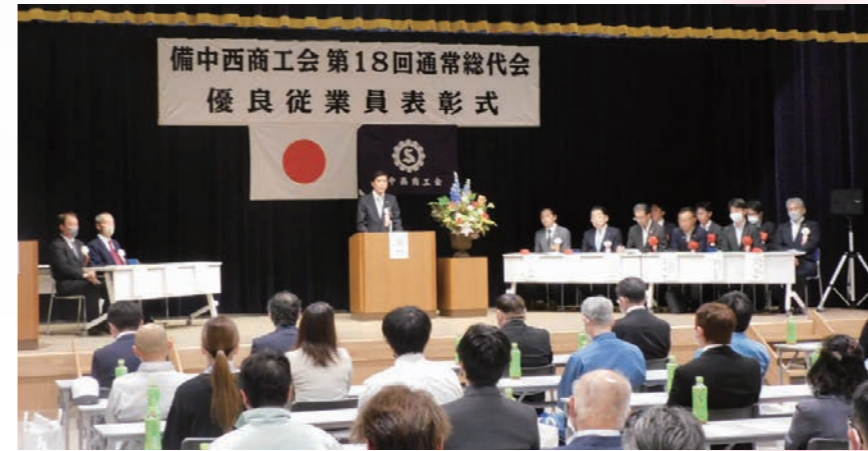
名合会長のあいさつ

本部 小田郡矢掛町小林163-2 TEL 0866-82-0559 FAX 0866-82-0707 芳井支所 井原市芳井町吉井4110-1 TEL 0866-72-0247 FAX 0866-72-1435 美星支所 井原市美星町三山4365-2 TEL 0866-87-2064 FAX 0866-87-2084