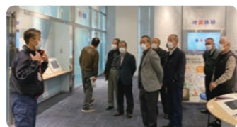
防災についての説明を拝聴

事業報告では、2月10日～11日、12名で四国中央市防災センターを訪問。防災シアター、地震体験、消火体験など学び防災意識の高揚を図りました。また、中国製50万円EVの分解解説等の研修会へ参加、はなしの里の「憩いの館」ウッドデッキ防腐塗装作業も実施しました。