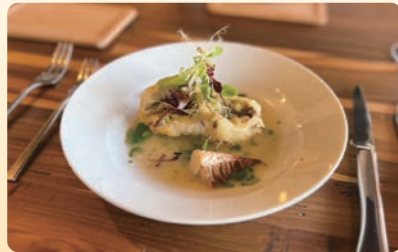
地元の食材を使用した料理