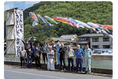
完成後の記念撮影