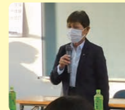
総会での部長挨拶