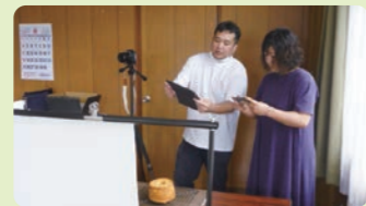
商品撮影の実践指導の様子