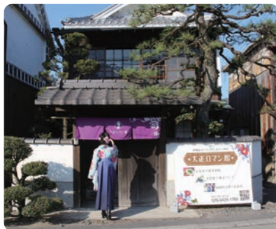
趣のある落ち着いた外観