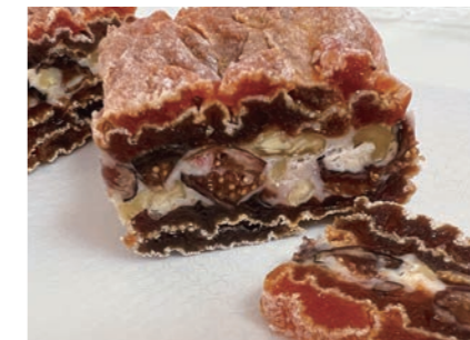
柿重ね お酒のおつまみにも最適