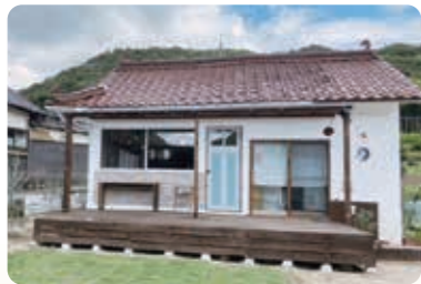
白色のかわいい外観