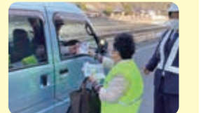
街頭啓発運動の様子

今後もこのような取り組みで、少しでも地域社会に貢献できるよう、引き続き活動していきたいです。