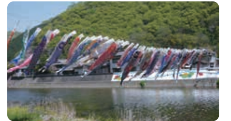
優雅に泳ぐこいのぼりたち

また、この事業を実施するにあたり、こいのぼりをご提供いただいた方々やご支援・ご協力を賜りました関係者の皆様には心から感謝申し上げます。