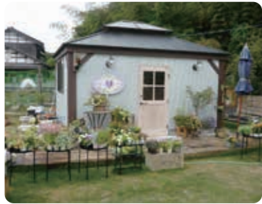
2重三角お屋根の店舗