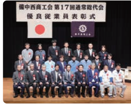
表彰を受けられた皆様、おめでとうございます。

昨年、一昨年は新型コロナウイルス感染症の影響を鑑み、式典を止む無く中止とさせていただきますが、本年度は地域内事業所から推薦された34名の受賞者の方々に、各事業所を通じて表彰状と記念品を贈呈いたしました。