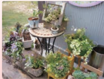
店外にも様々な種類のお花があります

また、お客様のご要望に合わせてオーダーメイドの製作もいたしますので、お友達や大切な方へのプレゼント、自分自身の癒しのご褒美としてお勧めいたしますし、ご自身で製作したいというお客様には体験レッスンもご用意しておりますので、是非一度お店にお立ち寄りください。