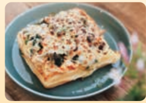
こだわりのクロックムッシュ 600円(税込)