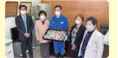
井原警察署長と商工会長、部員の皆様