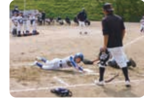
気迫のこもったプレー

5月29日(日)に開催された県大会には前回県大会3位でシードを獲得していた川面スポーツ少年団と山田スポーツ少年団の2チームが出場となりました。