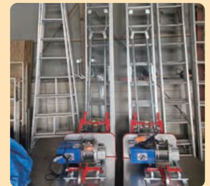
事業用設備の導入