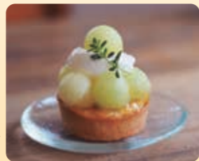
旬の果物を使った季節のタルトメロン 600円(税込)