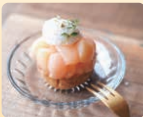
旬の果物を使った季節のタルトもも 600円(税込)

おススメは季節の果物を使ったタルトで、6月上旬からはメロン、7月中旬から桃を予定しています。運が良ければ…ソースから手作りしているクロックムッシュに出会えるかもしれません(限定数食)。そのほか、クッキーや手作りの小物も販売しています。ぜひ一度お立ち寄りください。