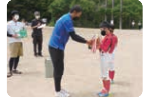
優勝 川面スポーツ少年団