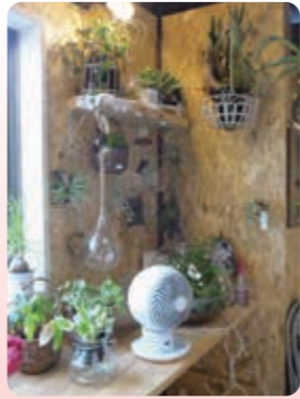
店内にあるお洒落なプリコラージュフラワー