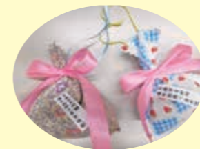
法音寺でご祈念したポプリ

歩行者の安全確保と横断歩道での安全確認に努めながら、少しでも交通事故が減るようにとの願いを込めて毎年ポプリを女性部員で作っています。安全・安心な街づくりに少しでも協力できるよう、これからも女性部活動を続けたいと思います。