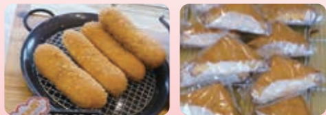
牛すじカレースティック 183円(税込) カステラトースト 173円(税込)

井原市・笠岡市・福山市においては、移動販売も行っておりますので、「カウ・ベル」のトラックを見かけた際は、ぜひお立ち寄りください。