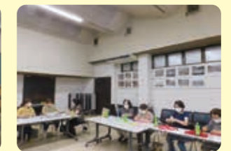
矢掛エリア作製風景