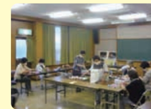
芳井エリア作製風景