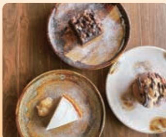
日替わりスイーツ