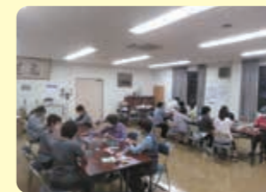
美星エリア作製風景