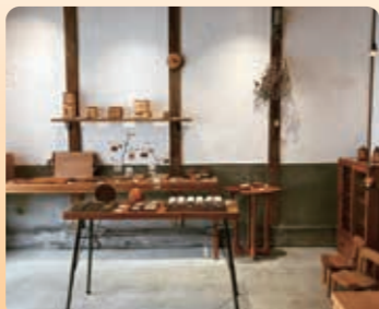
温かみのある内観