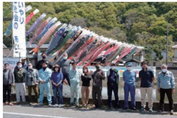
作業終了後に全員で記録撮影

この事業を実施するにあたり、思い出深い大切なこいのぼりをご提供頂いた方々、ご支援・ご協力を頂いた関係者の方々に心から御礼申し上げます。