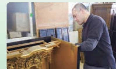
心を込めて、金箔を貼り直しています。

本格的な修復から簡易洗浄パック45,000円等、一部の施工まで対応します。とにかく笑うことが大好きな人間です。お気軽にお声掛けください。