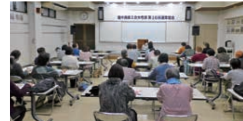
真剣に聞き入る部員の皆さん