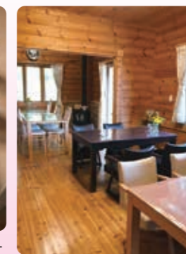
ログハウスの店内