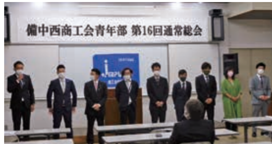
新役員の方々の皆さん