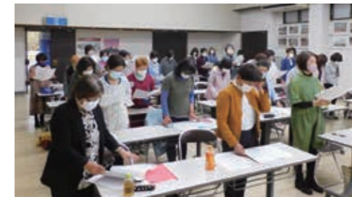
誓いの言葉を唱和する女性部員