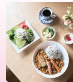
夏野菜いっぱいドライカレー 1,200円(税込)