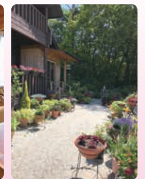
色とりどりの花がお出迎え