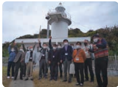
岡山県最南端の六島灯台にて記念撮影