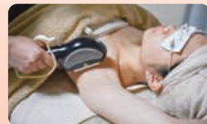
施術後のケアも安心の脱毛