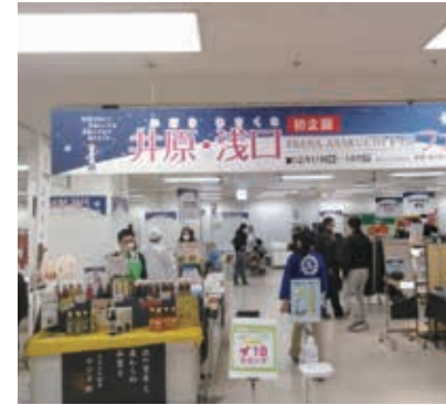
井原市の事業所も参加しました

会場では当商工会推奨の特産品を多くの方に知ってもらえる良い機会となり、今後も地区内事業者の販路開拓に繋がる支援を実施する予定です。