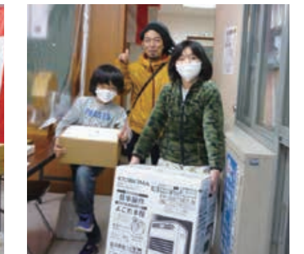
特賞当たりました