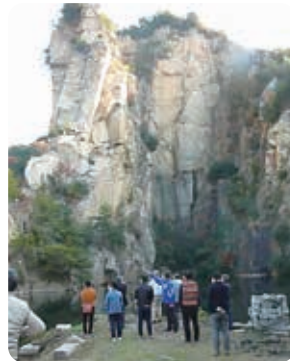
日本遺産である採石場跡の絶景