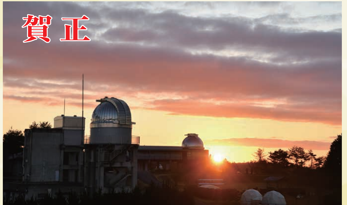
第二十三回 美星の四季写真コンテスト入賞作品「令和の初日の出」