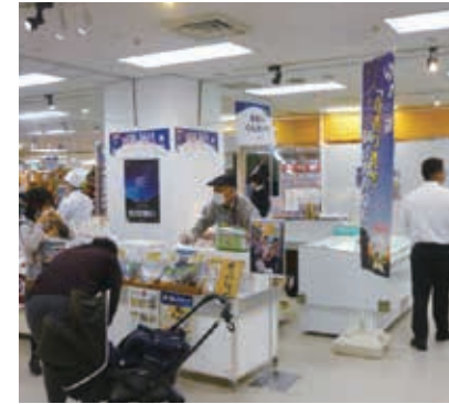
家族みんなで楽しみました