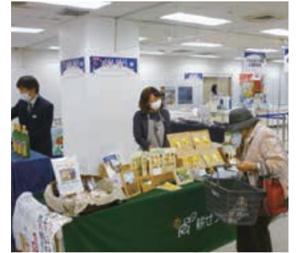
試食試飲も行いました