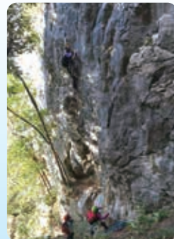
備中の岩場でのリードスクール