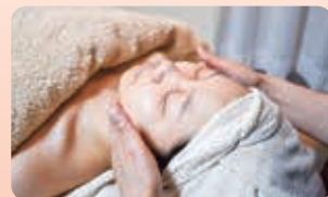
心地よい、フォトトリートメントコース