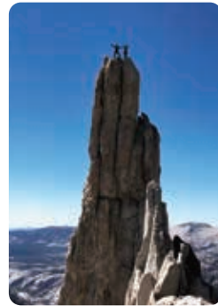
アメリカ、ヨセミテ渓谷での海外クライミングガイド

また、アウトダスクールだけではなく、クライミングツアー・山岳ガイド、クライミングジムのルートセット等も行ってまいります。詳細な事業内容や料金等についてはホームページをご覧ください。お気軽にお電話にてお問合せください。