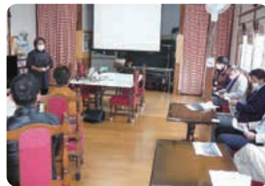
講師の話熱心に聞き入る委員の皆さん