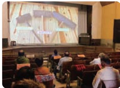
光劇場にて歴史映画鑑賞