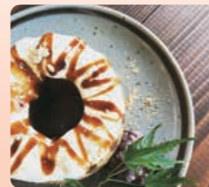
◀米粉シフォンケーキ 600円(税抜) 畑のランチ 1,200円(税抜)▶