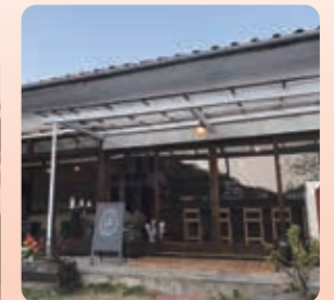
古民家風なお洒落な店舗