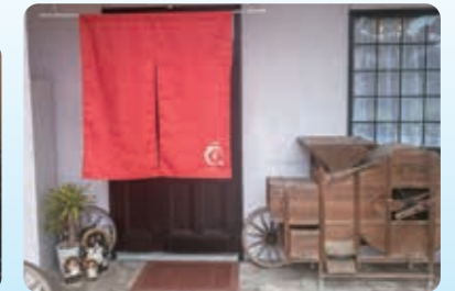
入口の古い農機具が目印です。