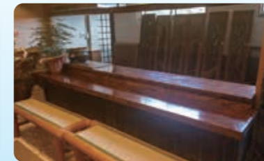
店内は純和風です。