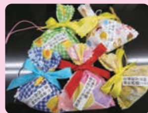
法音寺でご祈念したポプリ

また、エコキャップの回収も同時に行っています。今年は72キロのエコキャップを回収しました。エコキャップは再生プラスチック原料として換金し、医療支援や障がい者支援、子どもたちへの環境教育等、様々な社会貢献活動にあてられています。女性部員として、今後とも地域に役立つ社会活動にも協力していけたらと思います。