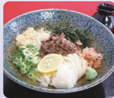
↑肉ぶっかけうどん

きつねうどん 500円 肉ぶっかけうどん 700円 小田寿司の おいなりさん 80円/個