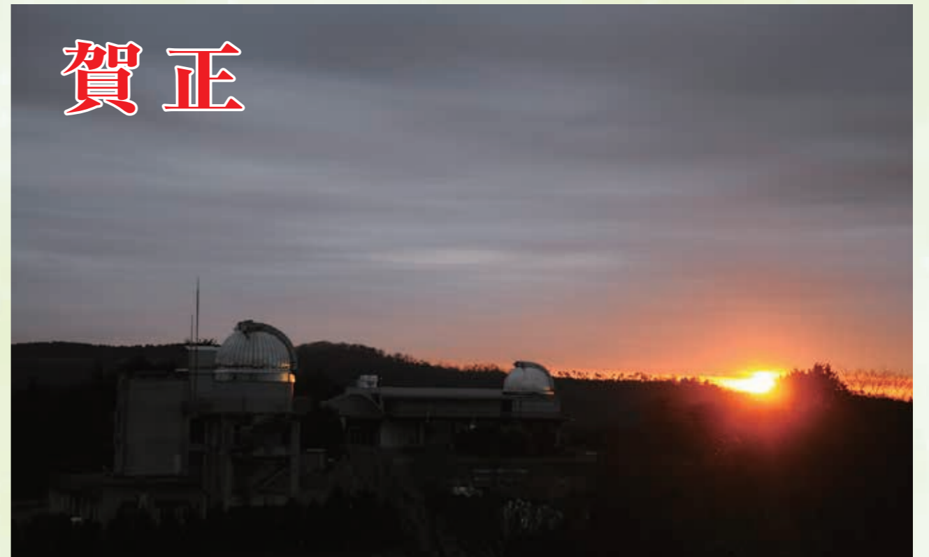
第二十二回 美星の四季写真コンテスト入賞作品