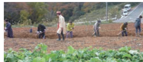
↑明治ごんぼうの収穫体験

また、芳井特産物直売所でのお買い物、「Ai+TaniCHAMPLOO」での昼食もあり、参加者からも「楽しかったのでまた参加したい」等の声を多数頂き、芳井町の魅力を存分に発信できたと感じています。