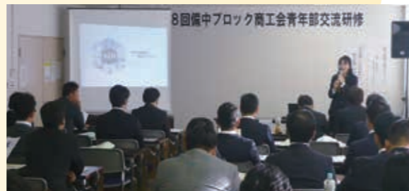
↑備中ブロックの部員交流会の様子

交流会では魚藤を会場に、普段関わりの少ない他地域の青年部員と、事業活動や経営に関する意見・情報交換を行い、交流を深めました。