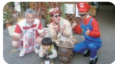
↑芳井の人気者とパチリ☆