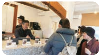
↑チョコレートカフェ見学

石を使ったアート体験では「やかげ観光大使やかっぱー」を描く人等、参加者思い思いの絵を描きました。