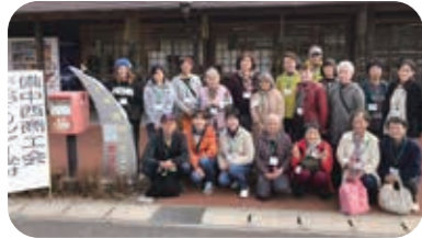
↑星の郷青空市に集合した参加者

「美星☆大満喫ツアー」では、美星の魅力体験をテーマに実施しました。星の郷青空市に集合し、買い物を楽しんで頂きました。