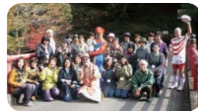
↑芳井魅力発見ツアー