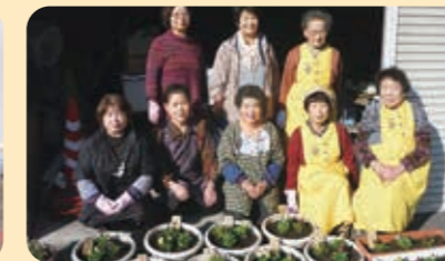
芳井エリアのみなさん