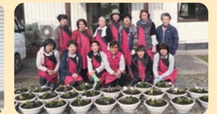
美星エリアのみなさん