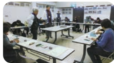
↑石を使ったアート体験