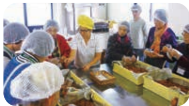
↑かりんとう工房見学