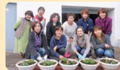
矢掛エリアのみなさん

皆さんに喜んでいただけるこのような地域貢献活動を、継続的に実施していきたいです。