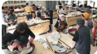
↑そば打ち体験をする参加者

「芳井の魅力発見ツアー」では、赤土の土壌で作られる明治ごんぼうの収穫体験、パン作り体験、山成酒造酒蔵見学・ごんぼうかりんとう工房見学を実施しました。